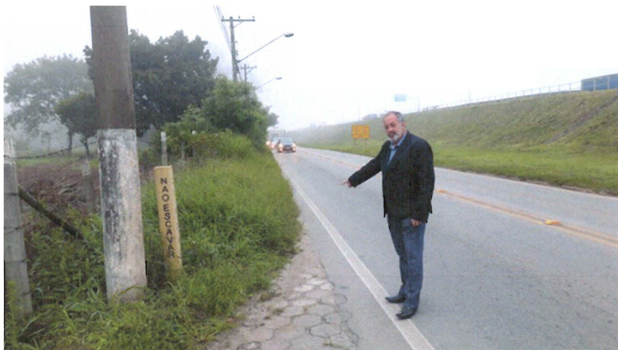
FOTOS: Rodovia Presidente Dutra, na altura do km 161.